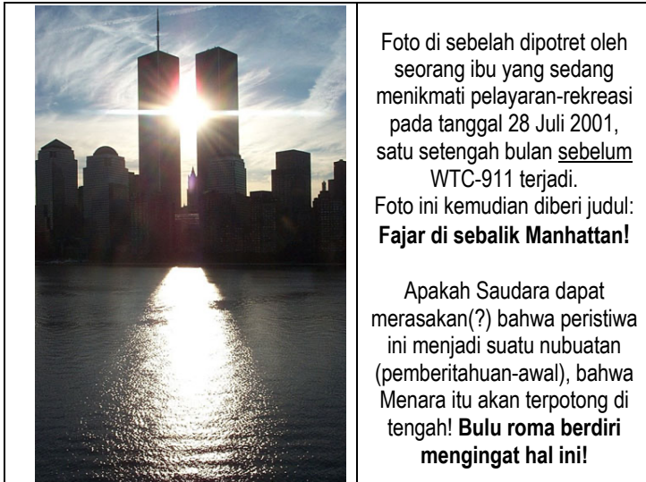
Foto di sebelah dipotret oleh seorang ibu yang sedang menikmati pelayaran-rekreasi pada tanggal 28 Juli 2001, satu setengah bulan sebelum WTC-911 terjadi.

Foto ini kemudian diberi judul: Fajar di sebalik Manhattan!